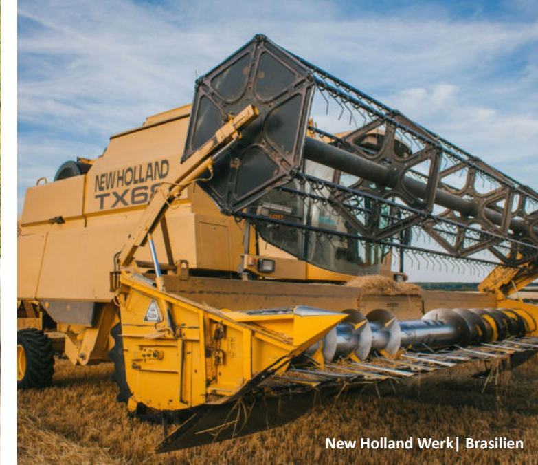
New Holland Werk | Brasilien