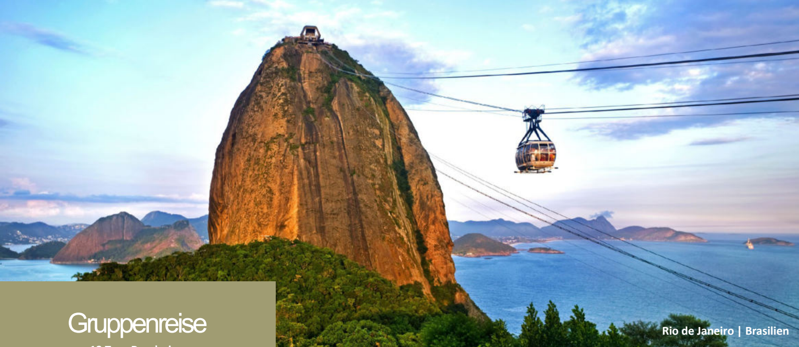
Rio de Janeiro | Brasilien