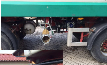
83135 Hochstätt - Te