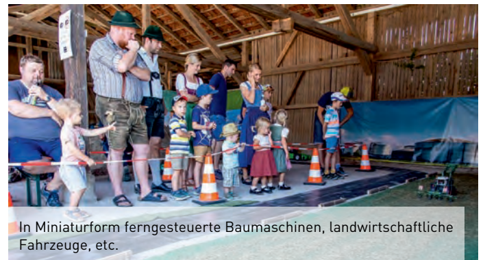
In Miniaturform ferngesteuerte Baumaschinen, landwirtschaftliche Fahrzeuge, etc.

Auch der Innenhof des Schmiedhofs war am Festsonntag gut gefüllt. Hier waren die Minitruckfreunde vertreten. Viele große und kleine Kinder harrten stundenlang am Schauplatz aus und sahen dem Spektakel gespannt zu. Vielen Dank an die "Minitruck Freunde Berchtesgaden", die hier ehrenamtlich Jung und Alt zum Staunen brachten.