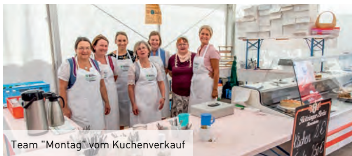
Team "Montag" vom Kuchenverkauf