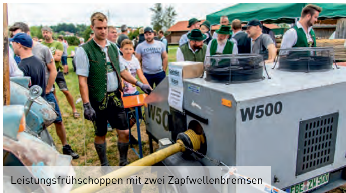
Leistungsfrühschoppen mit zwei Zapfwellenbremsen

Auf dem Festgelände fand am Montag zeitgleich auch ein von uns organisiertes Mopedtreffen statt - mehr als 100 Stück wurden gezählt. Die teils aufwendig hergerichteten Mopes konnten den ganzen Tag über bestaunt und manachmal sogar für eine "Probefahrt" ausprobiert werden.