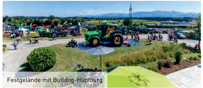
Festgelände mit Bulldog-Hüpfburg