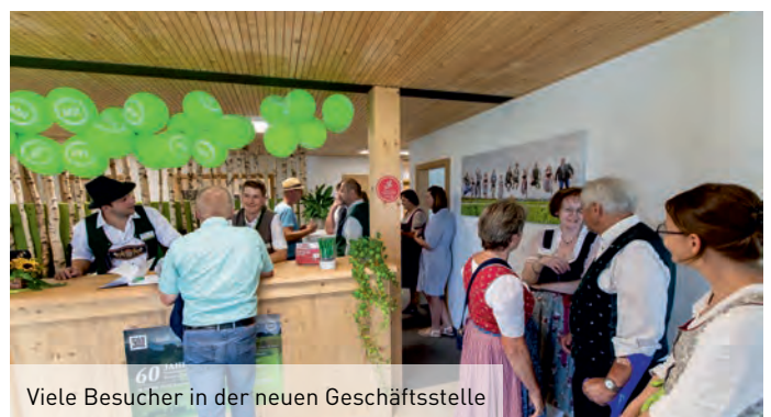
Viele Besucher in der neuen Geschäftsstelle