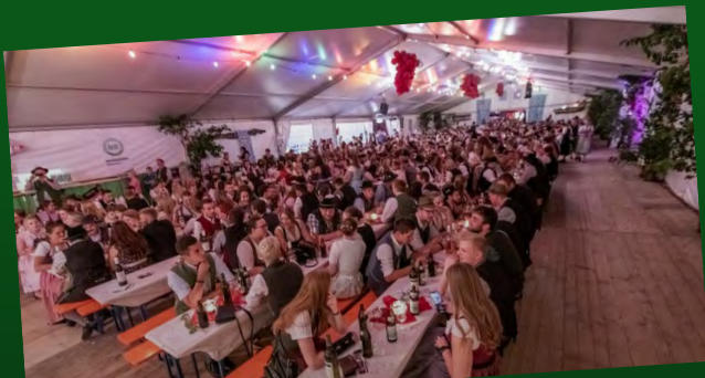
Maschinenring-Jubiläum Wir ziehen positive Bilanz!