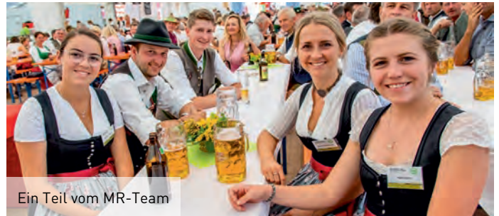
Ein Teil vom MR-Team

Den ganzen Sonntag über gab es ein Programm für Jung und Alt. Verschiedene Standl aus der ganzen Region sorgten für Marktfeeling, eine Hüpfburg stand für die Kleinsten bereit und im Festzelt gab es zur Stärkung eine kühle Maß Bier. Der Kuchenverkauf wurde jeweils an beiden Festtagen von den Landfrauen des BBV und der Frauengemeinschaft Stephanskirchen organisiert. Die Frauengemeinschaft hat anlässlich ihres 100-jährigen Bestehens zudem über 100 Kuchen gespendet. Auch aus unseren Mitgliedsreihen kamen einige Kuchen Spenden zusammen. Insgesamt waren es an den zwei Tagen über 200 Stück, welche über die Theke gingen. Der Erlös des gesamten Kuchenverkaufs geht an soziale Projekte. Wir bedanken uns ganz herzlich bei allen Kuchen Spendern, den Landfrauen und natürlich der Frauengemeinschaft Stephanskirchen.