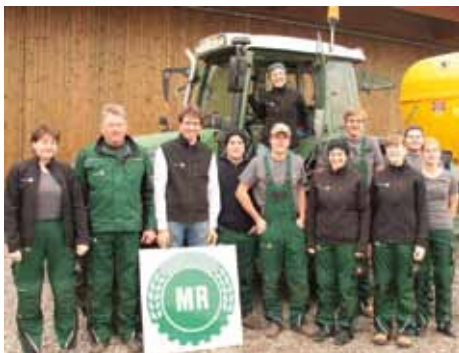
Betriebshelfer des MR Rosenheim in ihrer Arbeitsbekleidung.

Wer sich als Betriebshelfer/-in selbstständig machen möchte, der soll sich bitte mit uns in Verbindung setzen. Einfach anrufen, wir helfen Dir gerne weiter.